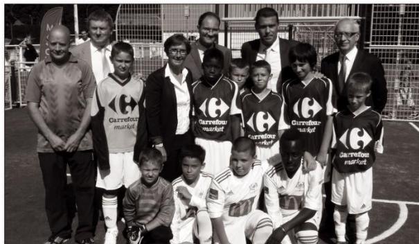
L'équipe des U13 de l'A.L.M. est doublement heureuse : elle peut enfin fouler le nouvel espace multisports, puis elle pose en compagnie de Madame la Ministre des Sports, de la Jeunesse, de l'Éducation populaire et de la Vie associative.

Inutile de commenter le sentiment de fierté ressenti par ces deux valeureux acteurs de la vie associative de se voir décerner cette haute distinction officielle des mains de Madame la Ministre.