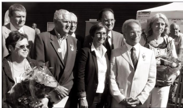
Les deux récipiendaires encadrent Madame la Ministre qui vient de leur remettre leur médaille d'Or de la Jeunesse et des Sports.