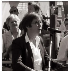
Madame la Ministre des Sports, de la Jeunesse, de l'Éducation populaire et de la Vie associative pendant son allocution.