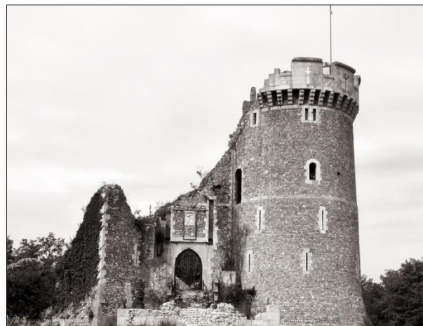
Le château Robert le Diable est en cours de restauration par une association de réinsertion, dont le siège se trouve à Elbeuf, au moyen de plusieurs équipes d'ouvriers qui se relaient.